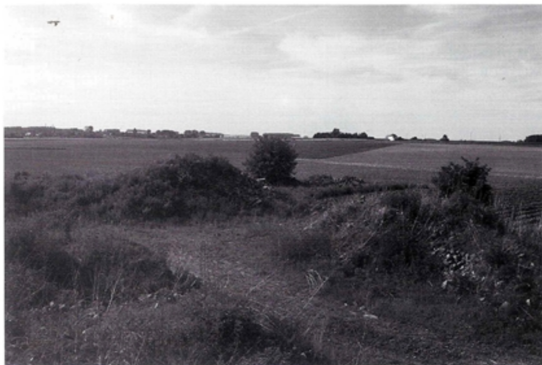
La carrière de "Cattenifosse" est actuellement comblée par des déchets inertes.